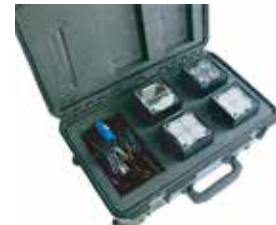
軽量でコンパクトサイズなので 運搬、移動が非常に楽です。