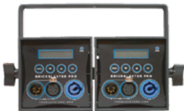
簡単な作業でライトの連結が可能

1.1Kgと軽量ですので、オプションのアダプターを装着すれば標準的なライティングレールに取り付けも可能です(調光不可)。