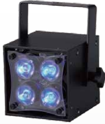
- 4C -