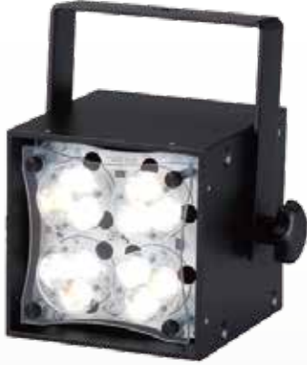
- WNC -