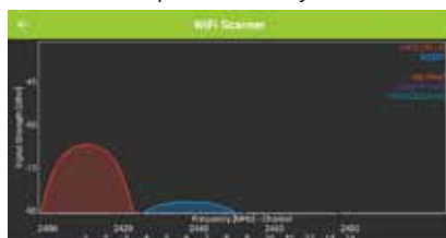
RF Spectrum Analyzer